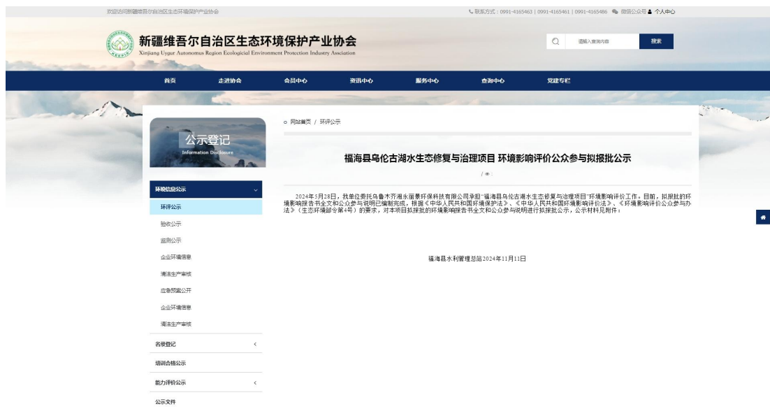
图 6.2-1 拟报批公示

我公司在向新疆维吾尔自治区生态环境厅报批环境影响报告书前，于 2024 年 11 月 11 日在新疆维吾尔自治区生态环境保护产业协会进行网络公示，载体选择符合《环境影响评价公众参与办法》要求。具体见 6.2-1。