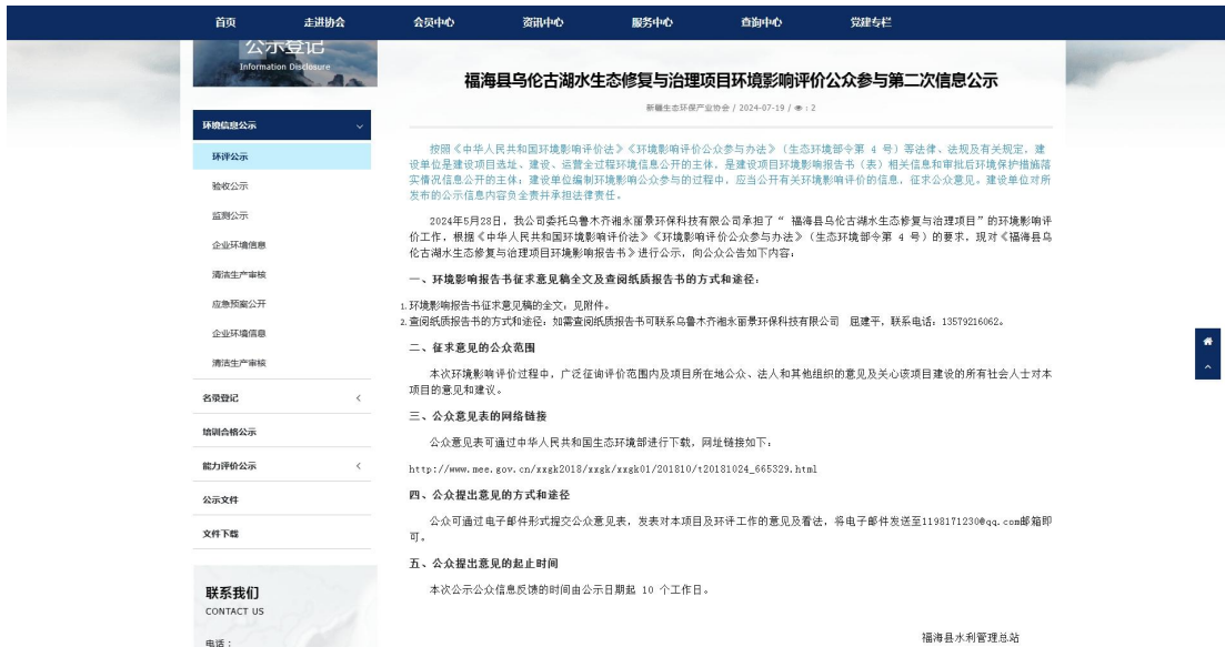
图 3.2-1 网站第二次公示