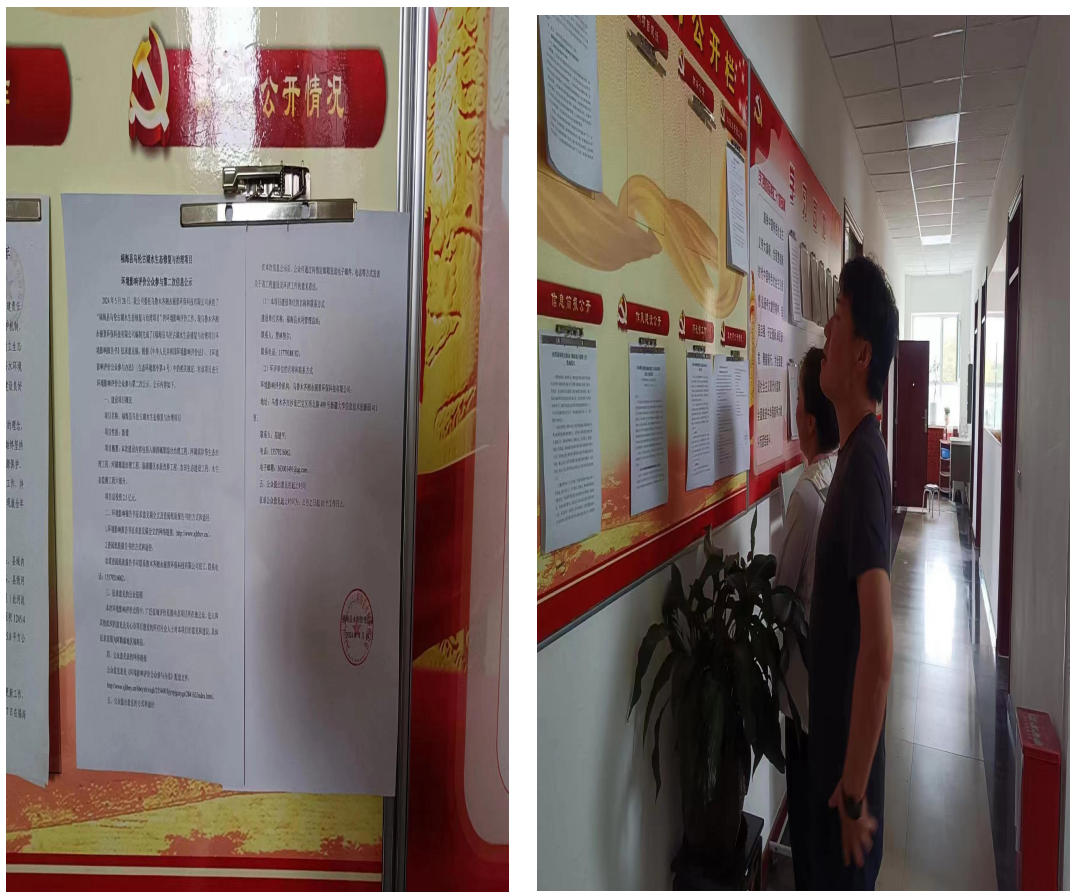
图 3.2-4 张贴公示照