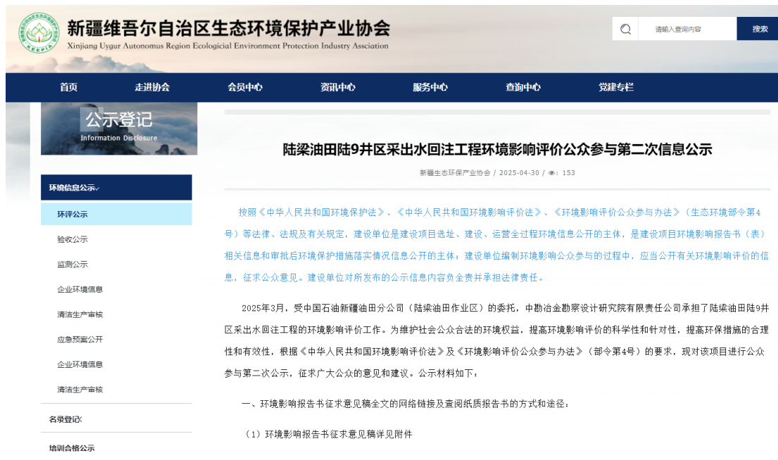
图 3-1 项目公众参与第二次信息公示截图

中国石油新疆油田分公司陆梁油田作业区于 2025 年 04 月 30 日在新疆维吾尔自治区生态环境保护产业协会网站刊登了项目第二次公众参与信息公示 ( http://www.xjhbcy.cn/articles/show/15395 ), 载体选择符合《环境影响评价公众参与办法》要求。公示截图请见图 3-1。