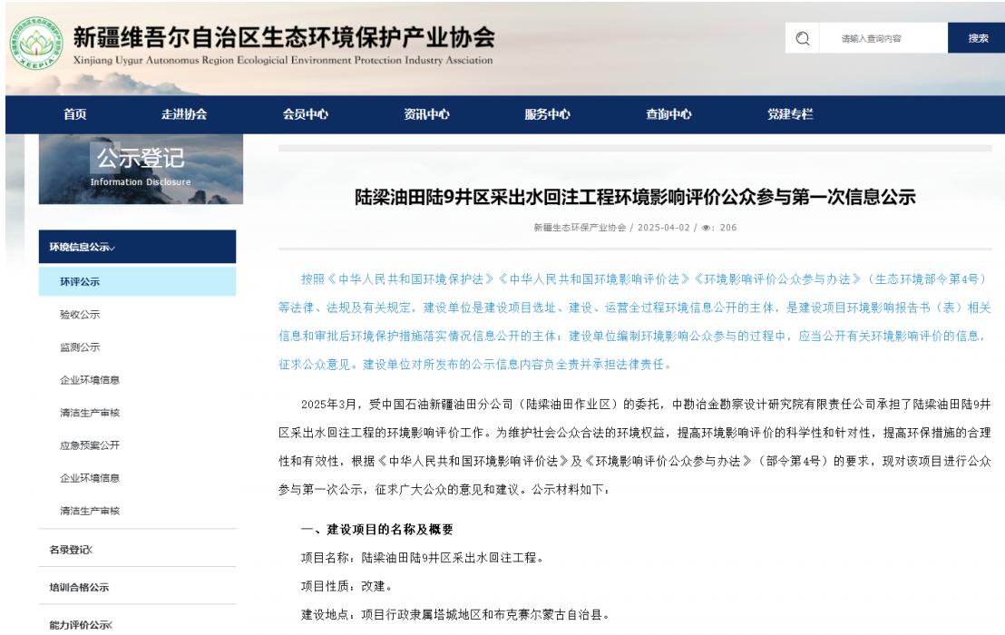
图 2-1 项目公众参与第一次信息公示截图